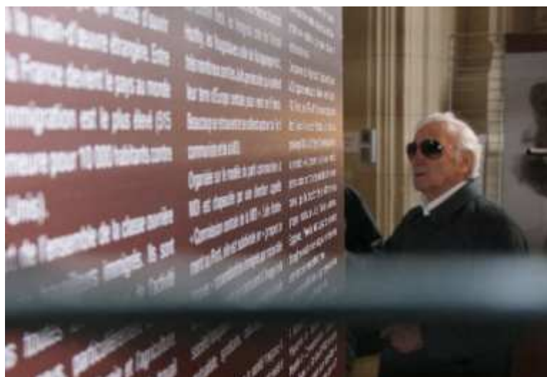
Détour de la mémoire