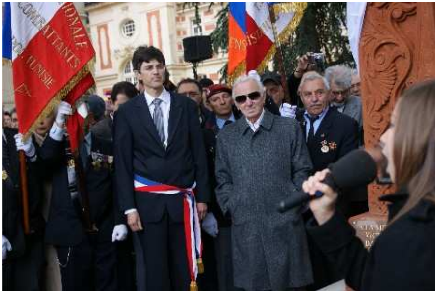
Les Hymnes : Arménien et Français interprétés par une élève de l'École Tebrotzassere