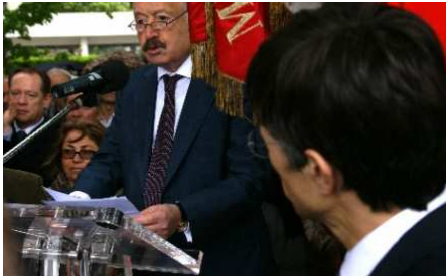
Discours de son excellence Viguen Tchitetchian